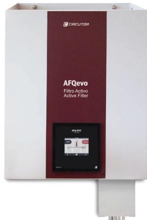
AFQevo z filtrem EMI (WF)